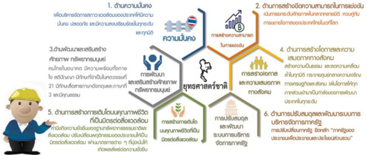
ภาพที่ ๑ กรอบยุทธศาสตร์ชาติระยะ ๒๐ ปี

ภารกิจของกระทรวงแรงงานมีส่วนที่เกี่ยวข้องใน ๕ ประเด็นยุทธศาสตร์ของยุทธศาสตร์ชาติ ระยะ ๒๐ ปี (พ.ศ. ๒๕๖๑ - ๒๕๘๐) ประกอบด้วย ๑) ยุทธศาสตร์ชาติ ด้านการเสริมสร้างและพัฒนาศักยภาพทุนมนุษย์ (หลัก) ๒) ยุทธศาสตร์ชาติ ด้านการสร้างความสามารถในการแข่งขัน (รอง) ๓) ยุทธศาสตร์ชาติ ด้านการสร้างโอกาสและความเสมอภาคทางสังคม (รอง) ๔) ยุทธศาสตร์ชาติ ด้านความมั่นคง (รอง) และ ๕) ยุทธศาสตร์ด้านการปรับสมดุลและพัฒนาระบบบริหารจัดการภาครัฐ (รอง) ตามลำดับ