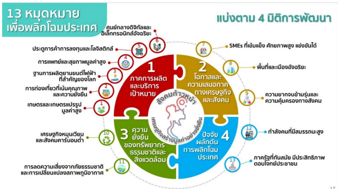
ภาพที่ ๒ กรอบแผนพัฒนาเศรษฐกิจและสังคมแห่งชาติ ฉบับที่ ๑๓

เป้าหมายหลักที่ ๓.๒.๕ การเสริมสร้างความสามารถของประเทศในการรับมือกับความเสียหายและการเปลี่ยนแปลงภายใต้บริบทโลกใหม่ โดยการสร้างความพร้อมในการรับมือและแสวงหาโอกาสจากการเป็นสังคมสูงวัย การเปลี่ยนแปลงสภาพภูมิอากาศ ภัยโรคระบาด และภัยคุกคามทางไซเบอร์ พัฒนาโครงสร้างพื้นฐานและกลไกทางสถาบันที่เอื้อต่อการเปลี่ยนแปลงสู่ดิจิทัล รวมทั้งปรับปรุงโครงสร้างและระบบการบริหารงานของภาครัฐให้สามารถตอบสนองต่อการเปลี่ยนแปลงของบริบททางเศรษฐกิจ สังคม และเทคโนโลยีได้อย่างทันเวลา มีประสิทธิภาพ และมีธรรมาภิบาล